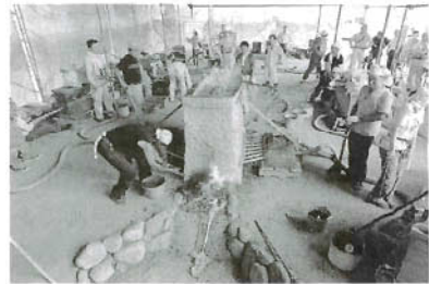
佐夜ノ谷Ⅱ遺跡製鉄炉の復元実験（無形文化財木原明村下とのコラボレーション）

ところで律令国家の成立過程で、さまざま方面に渡来人が関わったことは否定できないし、生産という場面でも同様であった。絶えず革新が求められたであろう鉄生産についても同じく考えると収まりがよいのであるが、当該時期における日本と朝鮮半島間の製鉄技術は規模も原理も