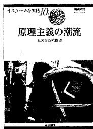
「イスラームを知る」既刊2冊の写真