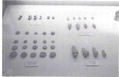
竹幕洞遺跡遠景と出土した石製模造品

さて、竹幕洞の祭祀遺跡は、古代において、沖ノ島の場合と同様に変遷がたどられる。まず、原三国（馬韓）時代から三国時代百濟初期にかけてのころに当たる3世紀後半のころから始まったと思われる土器を用いた祭祀は、百濟前期の4世紀中ごろから5世紀前半にかけてのころ、本格化する。つまり、壺・甕や高坏などの土器を使って祭祀が行われた。土器にはもちろん、神に捧げるために用意された酒や山海の珍味などの飲食物が盛られていたことであろう。